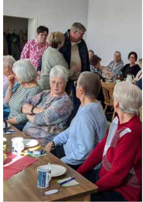
der Saal füllt sich

Fazit: Gute Stimmung, Spaß, Freude, Unterhaltung, leckerer Kuchen, soll unbedingt wieder stattfinden!