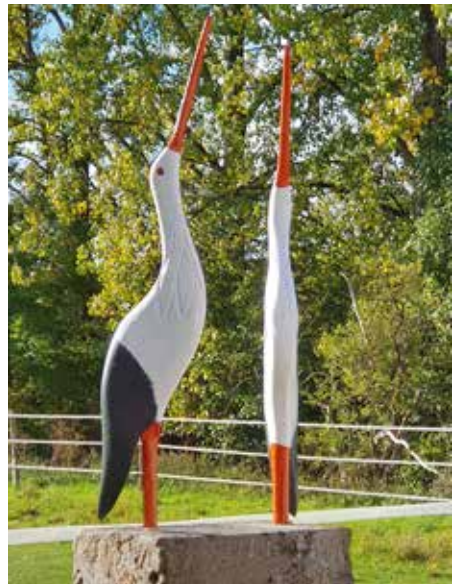
Der neue Hingucker an der Storchenwiese